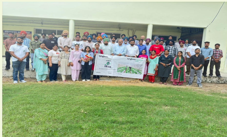
ਅਕਾਲ ਡਿਗਰੀ ਕਾਲਜ ਵਿਖੇ IRISE SYNGENTA FOUNDATION INDIA ਵੱਲੋਂ ਵਿਦਿਆਰਥੀਆਂ ਲਈ ਟ੍ਰੇਨਿੰਗ ਕੈਂਪ ਲਗਾਇਆ ਗਿਆ ।

For more information please visit at Punjabi University, Patiala's official website : www.punjabiversity.ac.in