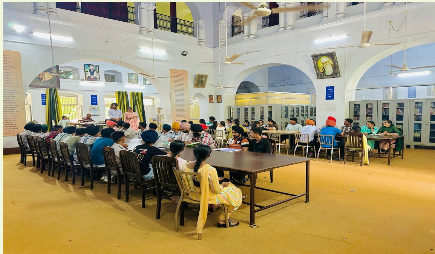
ਮਹਾਰਾਜ ਰਿਪੁਦਮਨ ਸਿੰਘ ਲਾਇਬਰੇਰੀ