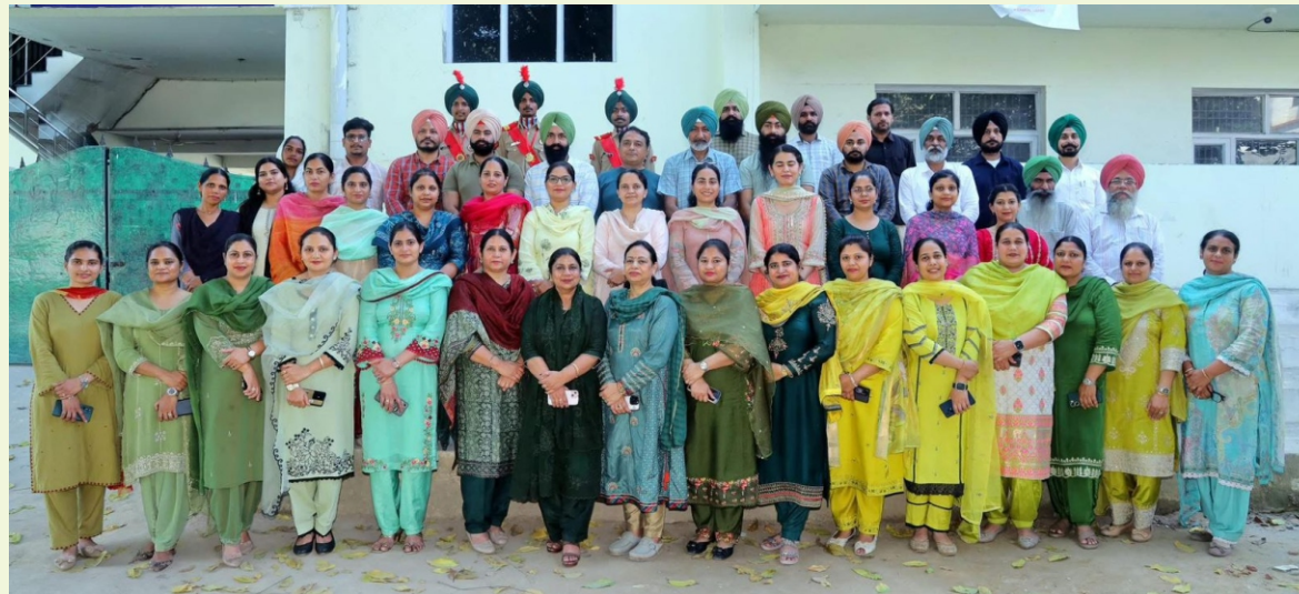
ਅਕਾਲ ਡਿਗਰੀ ਕਾਲਜ ਮਸਤੂਆਣਾ ਸਾਹਿਬ ਵਿਖੇ ਅੰਤਰ ਰਾਸ਼ਟਰੀ ਮਹਿਲਾ ਦਿਵਸ ਮੌਕੇ ਪ੍ਰਿੰਸੀਪਲ ਅਤੇ ਸਟਾਫ਼ ।

ਲਾਇਬਰੇਰੀ ਵਿੱਚ ਪੰਜਾਬੀ, ਅੰਗਰੇਜ਼ੀ ਅਤੇ ਹਿੰਦੀ ਭਾਸ਼ਾਵਾਂ ਦੀਆਂ ਅਖਬਾਰਾਂ ਆਉਂਦੀਆਂ ਹਨ। ਅਖਬਾਰਾਂ ਪੜ੍ਹਨ ਲਈ ਅਖਬਾਰਾਂ ਦੇ ਕਈ ਸਟੈਂਡ ਉਪਲੱਬਧ ਹਨ। ਲਾਇਬਰੇਰੀ ਨੂੰ ਮੁਫਤ ਪ੍ਰਾਪਤ ਹੋਣ ਵਾਲੇ ਮੈਗਜ਼ੀਨ ਅਤੇ ਰਸਾਲਿਆਂ ਨੂੰ ਵੱਖਰੇ ਤੌਰ 'ਤੇ ਪ੍ਰਦਰਸ਼ਿਤ ਕੀਤਾ ਜਾਂਦਾ ਹੈ। ਲਾਇਬਰੇਰੀ ਪੂਰੀ ਤਰ੍ਹਾਂ ਕੰਪਿਊਟਰਾਈਜ਼ਡ ਹੈ ਅਤੇ ਸਾਰੇ ਕੰਪਿਊਟਰਾਂ ਨੂੰ ਨੈੱਟਵਰਕਿੰਗ ਰਾਹੀਂ ਆਪਸ ਵਿੱਚ ਜੋੜਿਆ ਗਿਆ ਹੈ ਤਾਂ ਕਿ ਆਨ-ਲਾਈਨ ਪੜ੍ਹਨ ਸਮੱਗਰੀ ਤੱਕ ਅਸਾਨੀ ਨਾਲ ਪਹੁੰਚ ਬਣਾਈ ਜਾ ਸਕੇ।